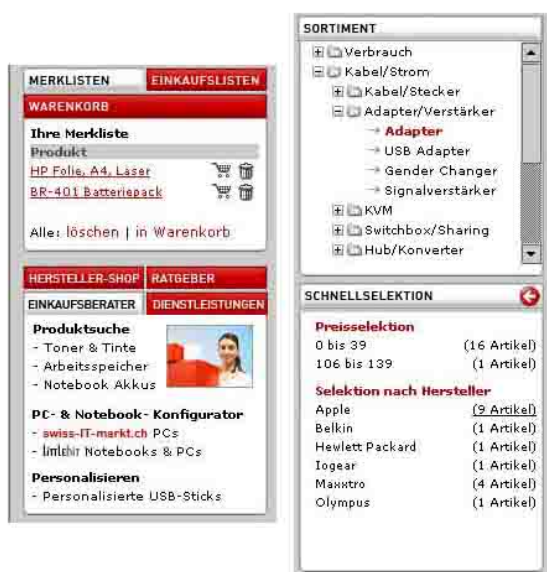
Abb.2: Merkliste, Sortiment, Schnellelektion

Es wurde eine vollständige Mehrsprachigkeit und Währungsfähigkeit bei absoluter gestalterischer Flexibilität bzw. Einbindung der vorgegebenen Corporate Design-Richtlinien des Unternehmens geschaffen.