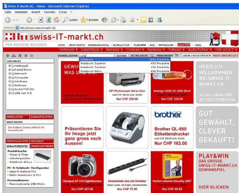
Abb.4: Die Suche auf www.swiss-it-markt.ch

Durch die Einführung von Frontends, können im weiteren Verlauf auch mehrere Shops mit unterschiedlichen Designs und Artikeln auf einer myfactory-Instanz mit unterschiedlichem Handling - beispielsweise einer eigenen Betriebsstätte - realisiert werden.