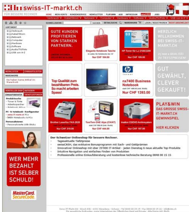
Abb.1: Startseite www.swiss-it.markt.ch

Am Anfang stand die Anpassung und Weiterentwicklung der Webshops mittels des Basis-Webshop-Moduls von nlba.net sowie dessen vollständige Integration in das bereits bestehende myfactory-ERP-Umfeld.